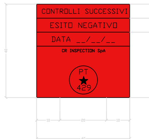
Etichetta Esito negativo

Tipologia etichetta: Distruttibile Dimensione etichetta: Quadrata (lato ≥ 40 mm) Colore etichetta: Scritte nere su fondo rosso