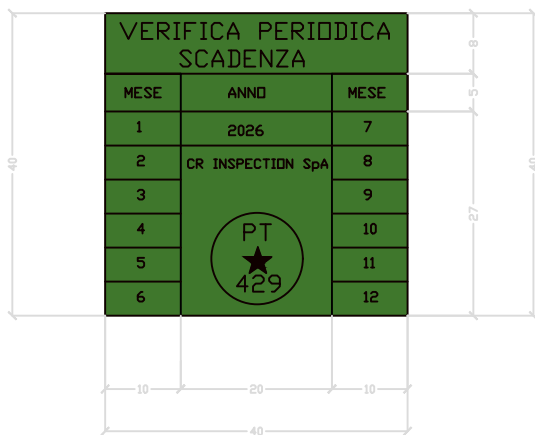
Etichetta scadenza verifica periodica

Tipologia etichetta: Distruttibile Dimensione etichetta: Quadrata (lato > 40 mm) Colore etichetta: Fondo verde con carattere di stampa nero